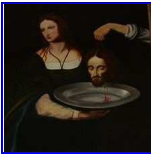
Décollation de Saint Jean-Baptiste